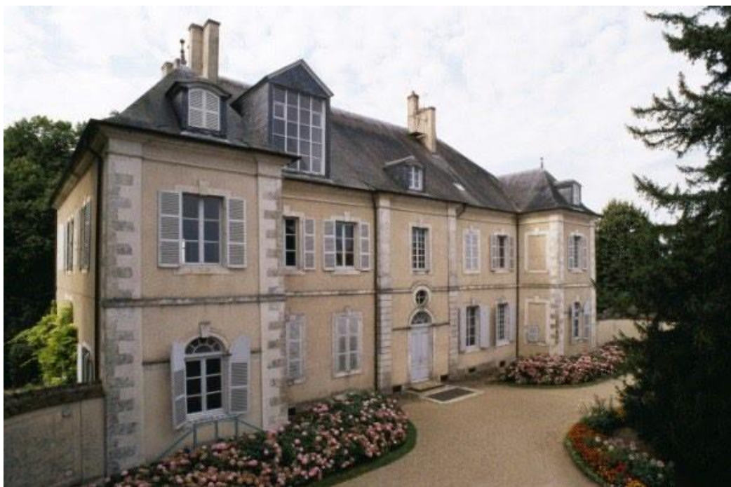
Maison de George Sand à Nohant

Posée « au bord de la place champêtre sans plus de faste qu'une habitation villageoise » : ainsi George Sand évoque-t-elle sa demeure de Nohant, située au fond d'une cour entourée de dépendances. Construit à la fin du XVIII e siècle pour le gouverneur de Vierzon, ce petit château fut acquis en 1793 par Mme Dupin de Francueil, grand-mère de George Sand, qui l'entoura d'un vaste parc. C'est dans ce cadre que se déroulèrent l'enfance et l'adolescence de la petite Aurore Dupin. Devenue plus tard une auteure majeure du XIX e siècle, elle y écrivit l'essentiel de son œuvre et y reçut nombre d'hôtes illustres : Liszt et Marie d'Agoult, Balzac, Chopin, Flaubert, Delacroix qui y eut son atelier... L'intérieur de la maison a conservé le décor que l'écrivain connut jusqu'à sa mort : salle à manger, chambre bleue, petit théâtre et théâtre de marionnettes.