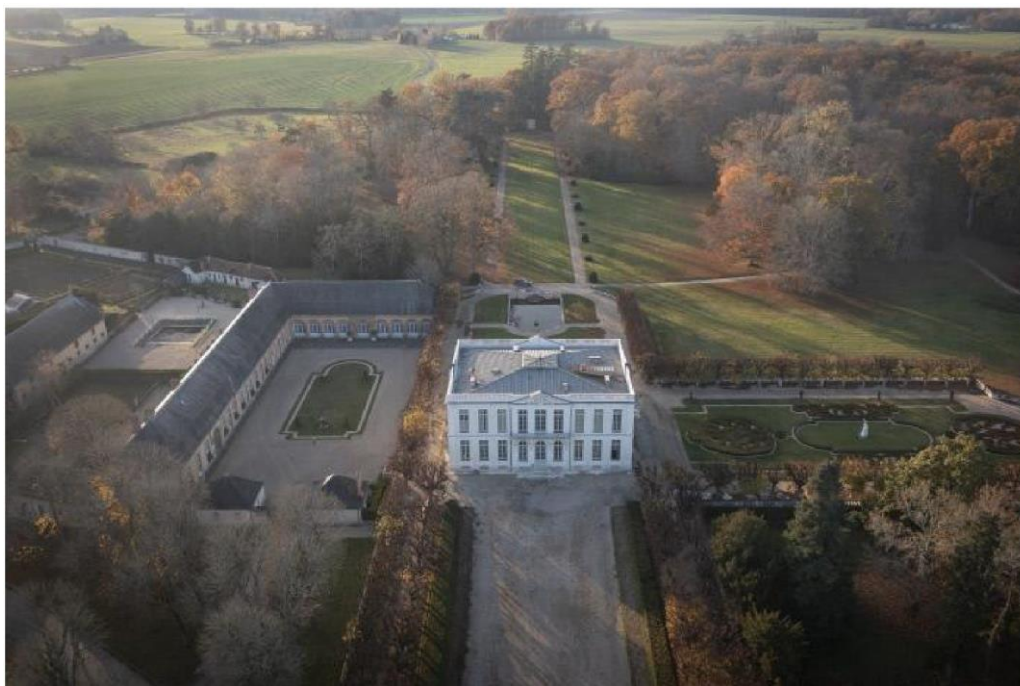
Château de Bouges

En 1759, Charles-François Leblanc de Marnaval acquiert les terres de Bouges. Il fait édifier le château de Bouges. L'actuelle demeure rappelle singulièrement le Petit Trianon de Versailles. Construction à l'italienne, le château de Bouges illustre avec élégance les arts du XVIII e siècle.