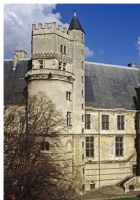
Palais Jacques-Coeur, façade occidentale, du côté de la ville basse