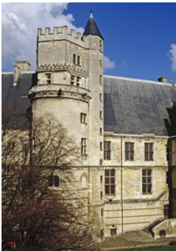
Palais Jacques-Coeur, façade occidentale, du côté de la ville basse

Située du côté de la ville basse, la tour de la Chaussée prendra son aspect actuel à partir de 1883, lors des travaux que mènera Emile Boeswillwald, inspecteur général des monuments historiques et collaborateur d'Eugène Viollet-le-Duc. Le parement médiéval en grand appareil de la partie basse sera remplacé par un parement néo gallo-romain en petit appareil de briques. C'est également lors de ces travaux que le grand comble en ardoise qui coiffait la tour sera supprimé et remplacé par le terrasson actuel.