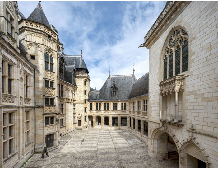
Palais Jacques-Cœur, cour d'honneur, vue d'ensemble depuis la galerie haute sud

De 1443 à 1451, date de son arrestation, Jacques Cœur fait construire à Bourges, point fixe de ses pérégrinations, un palais qu'il n'habitera pas. Œuvre d'un architecte inconnu, le palais Jacques Cœur est l'un des plus beaux édifices que nous ait laissés l'architecture civile gothique arrivée à sa dernière période, déjà marquée par la grâce et la fantaisie de la Renaissance française. Le palais s'ouvre sur la place Jacques Cœur par un pavillon d'entrée percé d'une grande porte et d'une poterne. Sur cette façade, comme sur toutes les autres parties de l'édifice, apparaissent les armes parlantes de Jacques Cœur : la coquille Saint-Jacques et le cœur, ainsi que sa célèbre devise « A vaillans cuers riens impossible ».