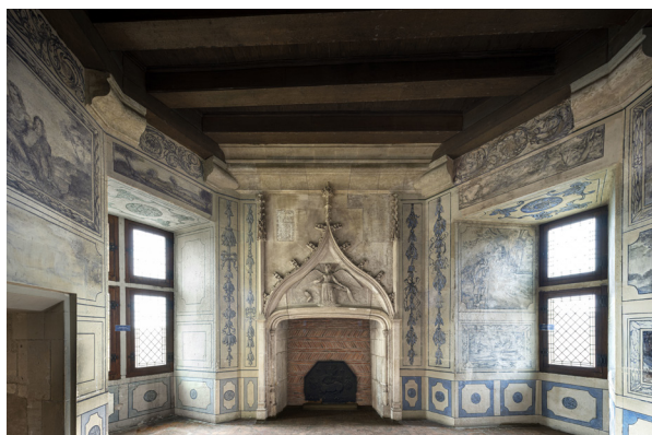
Palais Jacques-Coeur, cabinet des Échevins