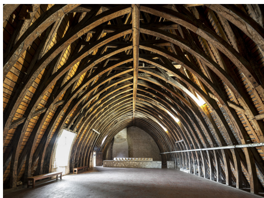
Palais Jacques-Coeur, grand comble