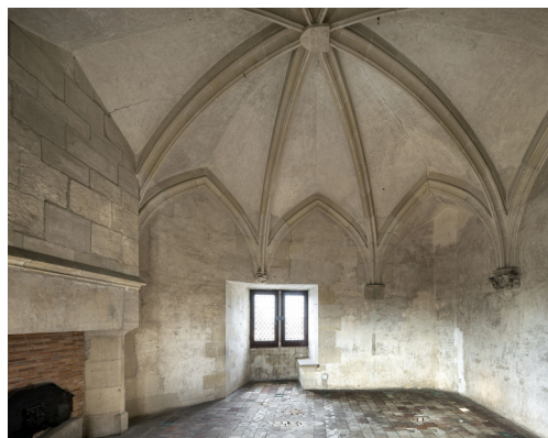
Palais Jacques-Coeur, salle du trésor