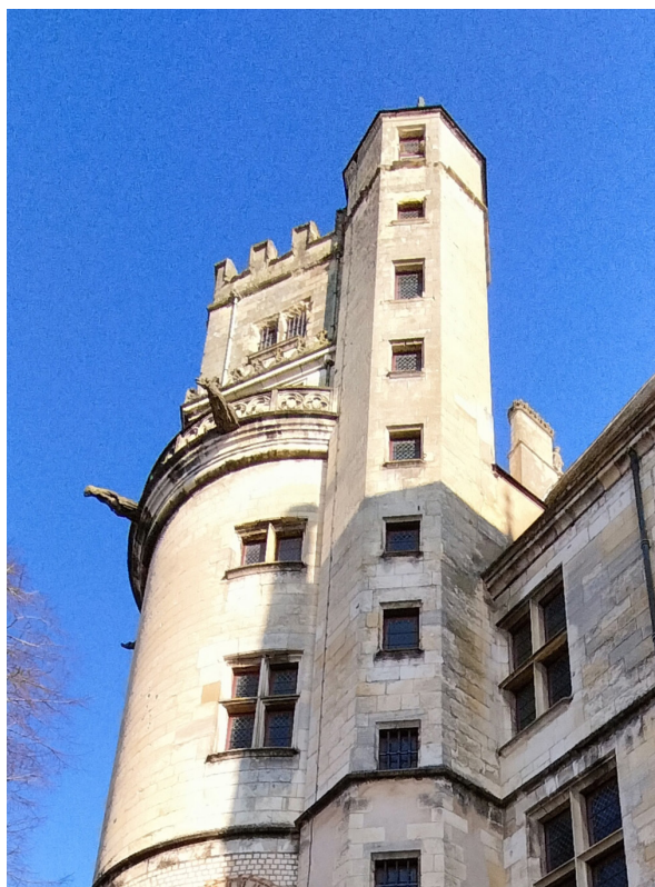
Palais Jacques-Cœur, façade occidentale, du côté de la ville basse

La tour de la Chaussée présente aujourd'hui des parements avec huit types de pierres différents. Cette hétérogénéité existe depuis la construction mais a été très accentuée par les restaurations des XIXe et XXe siècles. Le mauvais état général et l'état préoccupant des parties supérieures proviennent à la fois de défauts de conception des couvertures, de l'absence de maîtrise des évacuations des eaux pluviales et de la restauration du XIXe siècle. La présence de fuites et l'absence de mise à distance des eaux de pluie entraînent en effet la dégradation des parties hautes, notamment des fenêtres, ainsi que des pierres les plus tendres.