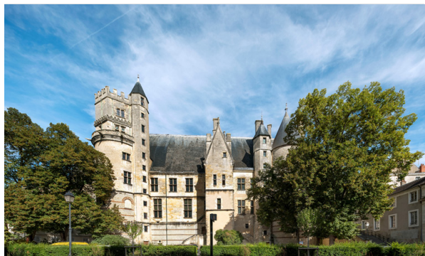
Palais Jacques-Coeur, façade occidentale