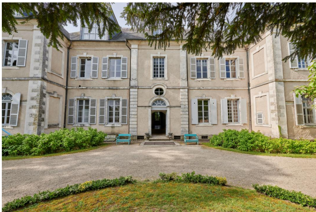
Maison de George Sand à Nohant

Posée « au bord de la place champêtre sans plus de faste qu'une habitation villageoise » : ainsi George Sand évoque-t-elle sa demeure de Nohant, située au fond d'une cour entourée de dépendances. Construit à la fin du XVIII e siècle pour le gouverneur de Vierzon, ce petit château fut acquis en 1793 par Mme Dupin de Francueil, grand-mère de George Sand, qui l'entoura d'un vaste parc. C'est dans ce cadre que se déroulèrent l'enfance et l'adolescence de la petite Aurora Dupin. Devenue plus tard une auteure majeure du XIX e siècle, elle y écrivit la majeure partie de son œuvre et y reçut nombre d'hôtes illustres : Liszt et Marie d'Agoult, Balzac, Chopin, Flaubert, Delacroix qui y eut son atelier... L'intérieur de la maison a conservé le décor que l'écrivain connut jusqu'à sa mort : salle à manger, chambre bleue, petit théâtre et théâtre de marionnettes.