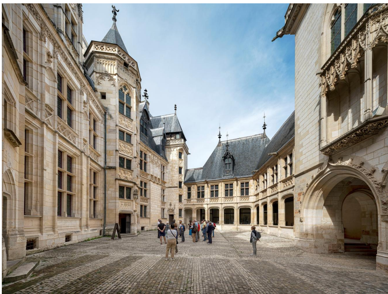
Palais Jacques-Coeur, visiteurs dans la cour d'honneur