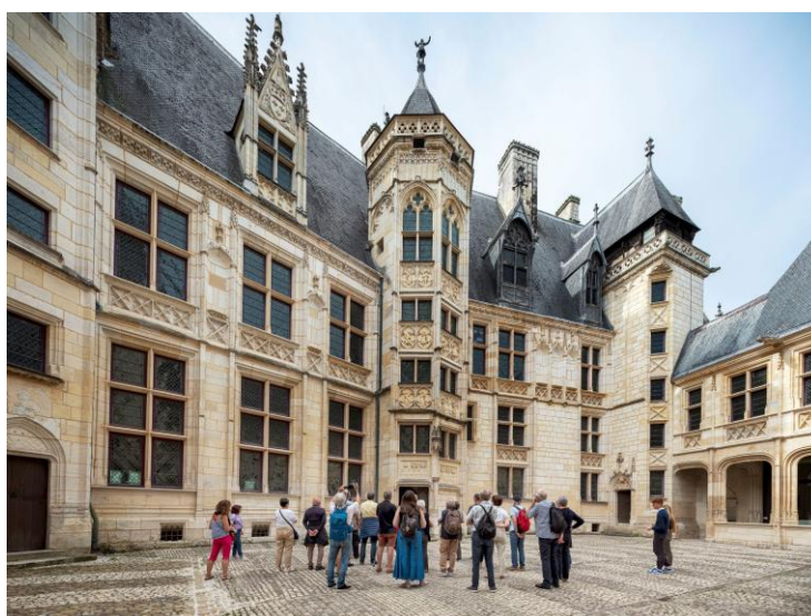
Palais Jacques Cœur, visiteurs dans la cour d'honneur

De 1443 à 1451, date de son arrestation, Jacques Cœur, grand marchand et financier français du XV e siècle fait construire à Bourges, point fixe de ses pérégrinations, un palais qu'il n'habitera pas. Œuvre d'un architecte inconnu, le palais Jacques Cœur est l'un des plus beaux édifices que nous ait laissés l'architecture civile gothique arrivée à sa dernière période, déjà marquée par la grâce et la fantaisie de la Renaissance française. Le palais s'ouvre sur la place Jacques Cœur par un pavillon d'entrée percé d'une grande porte et d'une poterne. Sur cette façade, comme sur toutes les autres parties de l'édifice, apparaissent les armes parlantes de Jacques Cœur : la coquille Saint-Jacques et le cœur, ainsi que sa célèbre devise « A vaillans cuers riens impossible ».