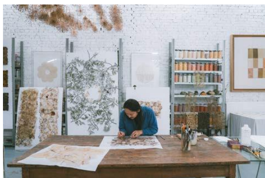
Duy Anh Nhan Duc, Atelier © Antoine Sennepin