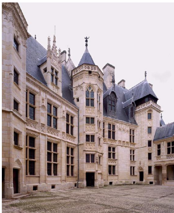
© Patrick Müller – Centre des monuments nationaux

De 1443 à 1451, date de son arrestation, Jacques Cœur fait construire à Bourges, point fixe de ses pérégrinations, un palais qu'il n'habitera pas. Œuvre d'un architecte inconnu, le palais Jacques Cœur est l'un des plus beaux édifices que nous ait laissés l'architecture civile gothique arrivée à sa dernière période, déjà marquée par la grâce et la fantaisie de la Renaissance française. Le palais s'ouvre sur la place Jacques Cœur par un pavillon d'entrée percé d'une grande porte et d'une poterne. Sur cette façade, comme sur toutes les autres parties de l'édifice, apparaissent les armes parlantes de Jacques Cœur : la coquille Saint-Jacques et le cœur, ainsi que sa célèbre devise « A vaillans cuers riens impossible ». La cour d'honneur est bordée de galeries couvertes. Un grand corps de logis, flanqué de trois tourelles d'escalier richement sculptées, occupe tout le fond de cette cour.