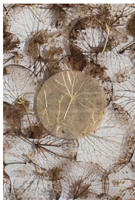
Duy Anh Nhan Duc, Dentelle d'Arbre de Judée, 2026 © Clémence Danon-Boileau